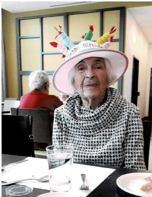
Chapeau décoré de bougies porté le jour de son anniversaire

Aujourd'hui à 99 ans, je la retrouve tout sourire dans le hall d'entrée de la résidence Le Quartier. J'ai la nette impression de pénétrer dans un hall d'hôtel de 4 étoiles, tellement c'est moderne et spacieux. Je