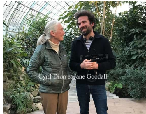
Cyril Dion et Jane Goodall

imaginer. ANIMAL s'attaque à l'autre grande crise écologique : la sixième extinction de masse des espèces. 68% des populations d'animaux sauvages vertébrés ont disparu en ces quarante dernières années. Le film nous emmène dans un voyage à travers le monde pour comprendre ce phénomène, et surtout, comment nous pourrions l'enrayer. Nous voulons tracer une autre histoire possible de l'avenir. Redonner espoir et enthousiasme. Nous en avons plus que jamais besoin.